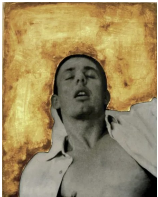
Icônes du temps présent , Michel Journiac (1988)

La série photographique Icônes du temps présent de Michel Journiac est réalisée à partir de photos de magazines pornographiques, de célébrités, de proches ou d'inconnus, magnifiés par des feuilles d'or et couvert de son propre sang. Mêlant sacré et profane, son travail vise à mettre en scène le corps dans sa matérialité la plus cruelle, devenant ainsi un outil d'intervention dans les champs du social et du politique.