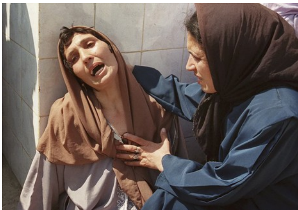
La Madone de Bentalha, Hocine Zaourar (1997)

Ces photographies de presse qui demeurent retrouvent plus ou moins consciemment des archétypes universels, comme ceux de la compassion ou de la révolte et elles sont efficaces parce qu'elles s'inscrivent dans la tradition iconographique et les codes symboliques du monde occidental.