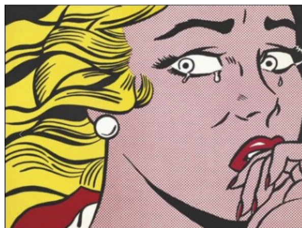
Crying Girl , Roy Lichtenstein (1963)

L'image de presse, industrielle et consommée en masse par les masses, évoque alors tout sauf l'art. Ironique, l'artiste Roy Lichtenstein agrandit de son côté, ces images et magnifie la technique en quadrichromie des points imprimés.