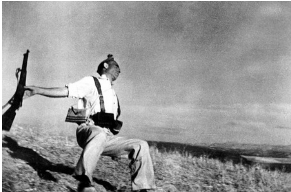
Mort d'un soldat républicain, Robert Capa (1936)

L'histoire de la photographie a été marquée par de nombreux clichés qui sont restés gravés dans l'esprit du monde entier. Un nouveau sens du mot icône est ainsi apparu au XXe siècle : l'icône comme photographie de presse devenue LA photographie, celle qui a une notoriété internationale.