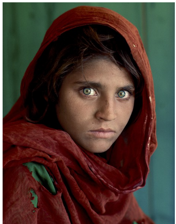
Fille afghane au camp de réfugiés de Nasir Bagh, Steve McCurry (1984)

Le choix du cadrage est la décision la plus importante dans la création d'une image car il délimite l'espace virtuel de la photographie. Par le cadrage, le photographe établit des liens entre les différents éléments de l'espace virtuel, les structure dans une image plus ou moins cohérente et nous permet de la voir de manière globale.