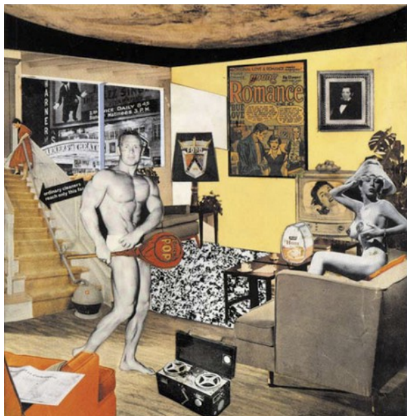
Just What Is It That Makes Today's Homes So Different, So Appealing? , Richard Hamilton (1956)

Depuis la deuxième moitié du XIXe siècle – époque qui coïncide avec celle de l'invention de la rotative, par l'américain Richard Hoe –, les artistes se sont emparés du journal d'abord comme objet puis comme matériau et comme sujet.