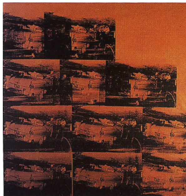
Cinq décès , Andy Warhol (1963)

Dans les années 1960, le regard des artistes se déplace sur le contenu du journal : l'information et sa représentation. « Avant les médias, il y avait une limite physique à l'espace qu'une personne pouvait occuper toute seule », écrira Andy Warhol dans son traité de philosophie publié en 1975.