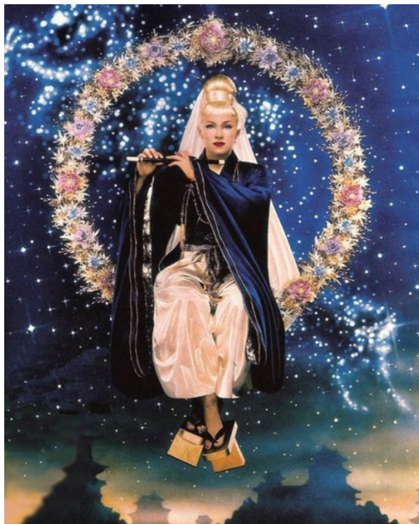
Legend (Madonna) , Pierre et Gilles (1995)

Spécialisé dans les portraits de célébrités et de mode, le duo Pierre et Gilles « crée des images qui mélangent réalité, vie de tous les jours, rêves et fantaisies », déclare Gilles. Leurs photographies peintes sur toile mettent en scène des personnages glamour, dans des atmosphères édulcorées. Entre érotisme d'Épinal et kitsch acidulé, leurs œuvres reprennent des figures emblématiques de la culture populaire, poussant la beauté et l'icône jusqu'au tragique.