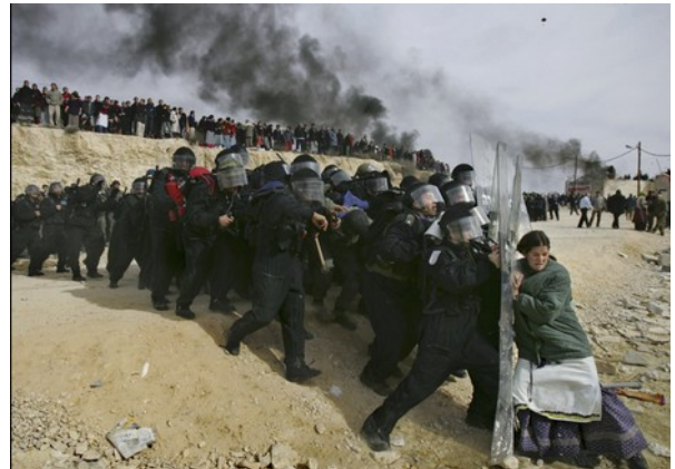
The Power of one, Oded Balilty (2007)

« L'image médiatique est une réduction du réel, elle est issue d'un choix iconiques, linguistiques typographiques... », écrivait Frédéric Lambert, sémiologue. Ainsi, plutôt que des images sans légende, les fleurons du photojournalisme sont à proprement parler des légendes en image, des stéréotypes visuels élaborés pour faciliter la compréhension.