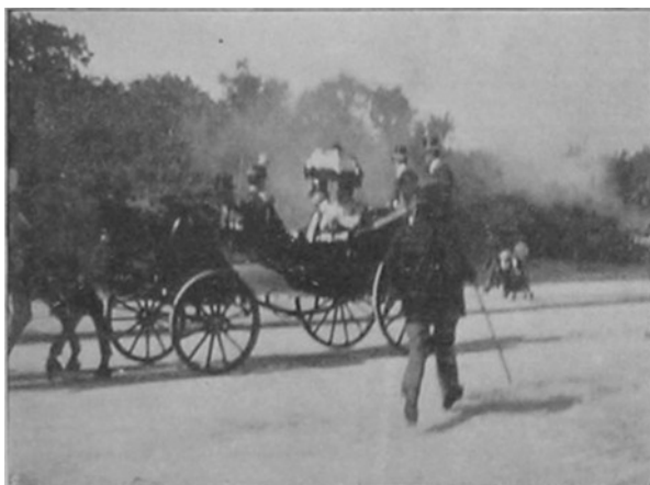
Attentat au bois de Boulogne, L'illustration (1897)

Alors même que la photographie s'impose comme pratique documentaire, les imprimeurs privilégient longtemps encore les procédés techniques fondés sur le dessin en noir et blanc. Ce n'est qu'au tournant des XIXe et XXe siècles que la photographie prend le pas sur les autres images d'actualités.