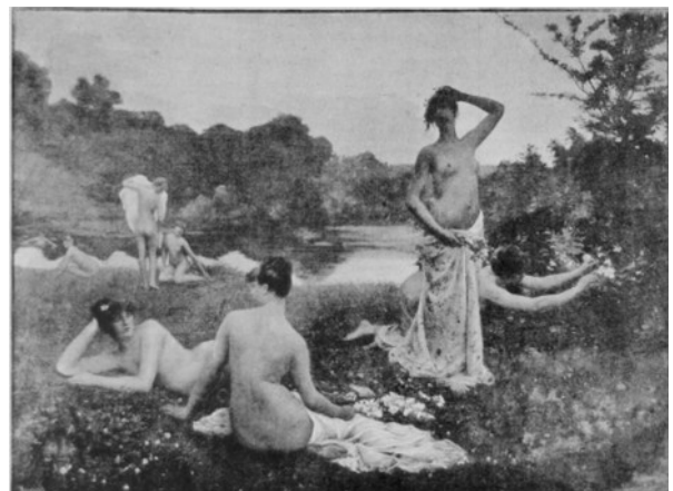
L'été, L'illustration (1884)

En imprimerie, la trame correspond à un maillage de points permettant de reproduire les documents monochromes. La trame classique est ainsi déterminée par un nombre de points fixe, régulièrement espacés dans les deux directions perpendiculaires, alignés avec un certain angle sur l'horizontale. La taille des points détermine le niveau de gris.