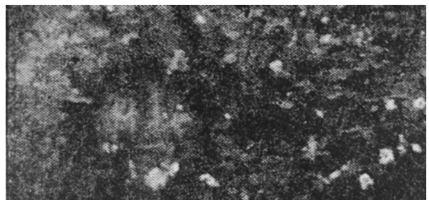
L'été (détail), L'illustration (1884)

Le procédé demi-ton - ou similitravure également connu sous l'anglicisme halftone - réduit l'image imprimée à une seule encre et forme avec cette encre des points de différentes tailles ou écarts. Cette reproduction est basée sur l'illusion d'optique que ces minuscules points forment plusieurs niveaux de gris.