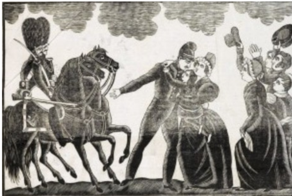
Départ d'un Républicain pour la prison du Mont-Saint-Michel, Canard (1833)

Née avec le XIXe siècle, la lithographie, souvent présentée comme déterminante dans le succès de la presse illustrée, est en fait très peu employée. Les éditeurs recourent encore, et durant une bonne partie du siècle, à la gravure sur bois, plus facilement insérable dans les formes typographiques. C'est sur cette technique que L'illustration , premier hebdomadaire d'actualités illustré en France, bâtit son succès. Et, dans son sillage, un grand nombre de titres de la presse illustrée.